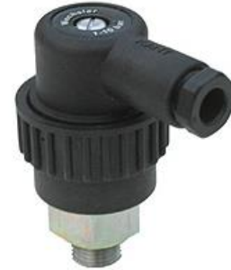
Mit Gerätestecker PG9

Maybachstraße 18 72175 Dornhan Tel +4974559461-0 Fax +4974559461-13 Email: info@kant-druckschalter.de www.kant-druckschalter.de