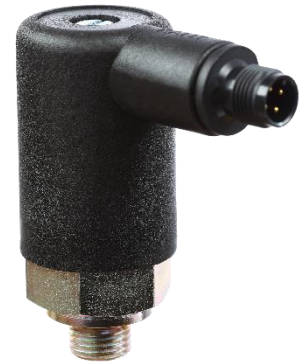
Mit Gerätestecker M12

Maybachstraße 18 72175 Dornhan Tel +4974559461-0 Fax +4974559461-13 Email: info@kant-druckschalter.de www.kant-druckschalter.de